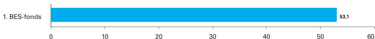
Figuur 3 Geraamde uitgaven BES-fonds (bedragen x € 1 mln.). Totaal € 53.094.000